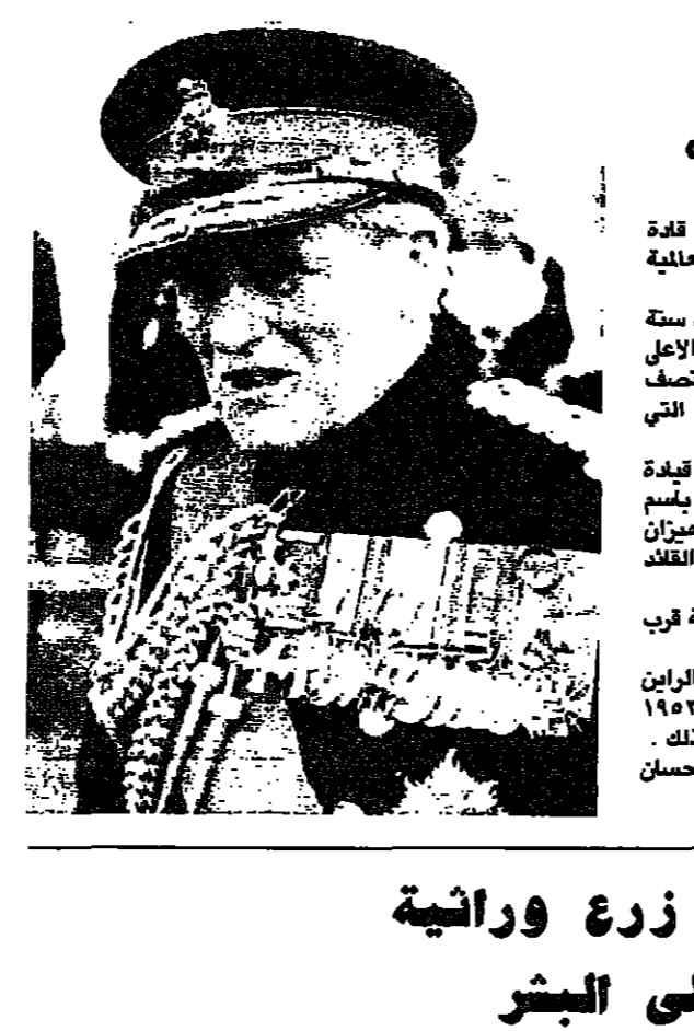
وفاء قائد «جردان الصحراء»

اضاف الاتحاد السوفياتي لقباً ثانياً في بطولة أوروبا للتزحلق الفني على الجليد التي تقام في مدينة برمنغهام... (The text discusses the author's achievements in figure skating.)